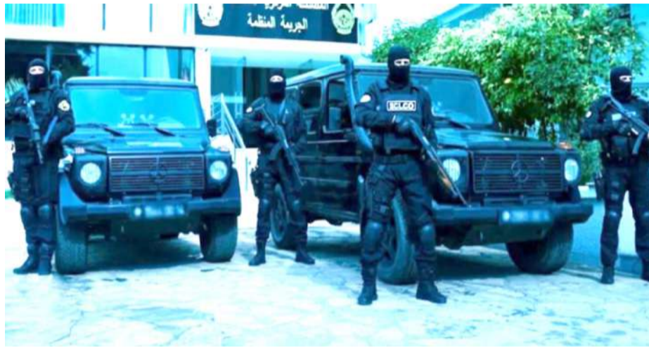
DIX PERSONNES ONT ÉTÉ ARRÊTÉES

E n effet, le service central de lutte contre le crime organisé (SCLCO), basé à Saoula, a réussi à démanteler le réseau criminel d'une organisation impliquée dans le détournement et la dilapidation de fonds publics au sein de la société United Tobacco Company (UTC), spécialisée dans le commerce et la distribution de tabac. Le préjudice financier est estimé à près de 1 000 milliards de centimes. Selon un communiqué de la Direction générale de la sûreté nationale (DGSN), une enquête de grande envergure, menée pendant plus de trois mois, a permis aux enquêteurs de la Brigade centrale de lutte contre les crimes économiques et financiers de mettre au jour un procédé frauduleux utilisé par certains employés de l'entreprise. Le stratagème consistait à enregistrer dans le système informatique de la société des produits du tabac sans qu'ils ne soient réellement réceptionnés par les filiales commerciales, avant de les écouler en dehors des circuits officiels par l'intermédiaire de grossistes. Ces pratiques ont engendré un déficit injustifié dans les stocks de produits du tabac de différentes marques, constaté lors de l'inventaire et de l'audit des comptes financiers de l'exercice 2025.